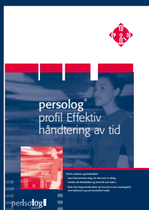
persolog® Effektiv håndtering av tid